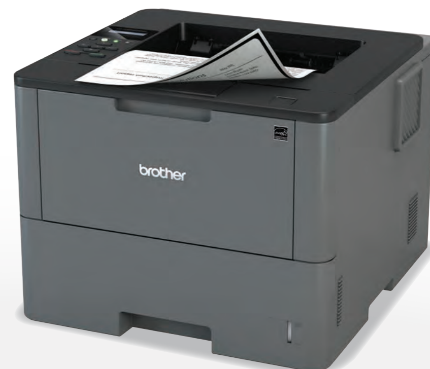
HL - L6200DW