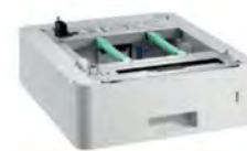
ถาดกระดาษเสริมสูงสุด 500 แผ่น LT-340CL**