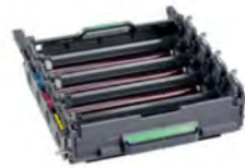
แม่แบบสร้างภาพ (ดรัม) DR-451CL ประมาณ 30,000 หน้า